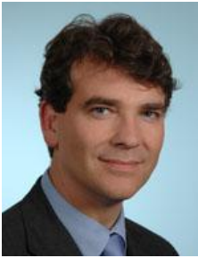
Arnaud MONTEBOURG , candidat à l'élection présidentielle, Secrétaire National à la rénovation, député et Président du Conseil Général de Saône-et-Loire

De 9h30 à 11h au Salon du Cercle Républicain 5, avenue de l'Opéra 75001