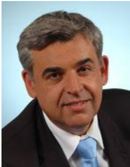
Président du Conseil Général et député SRC de l'Ardèche